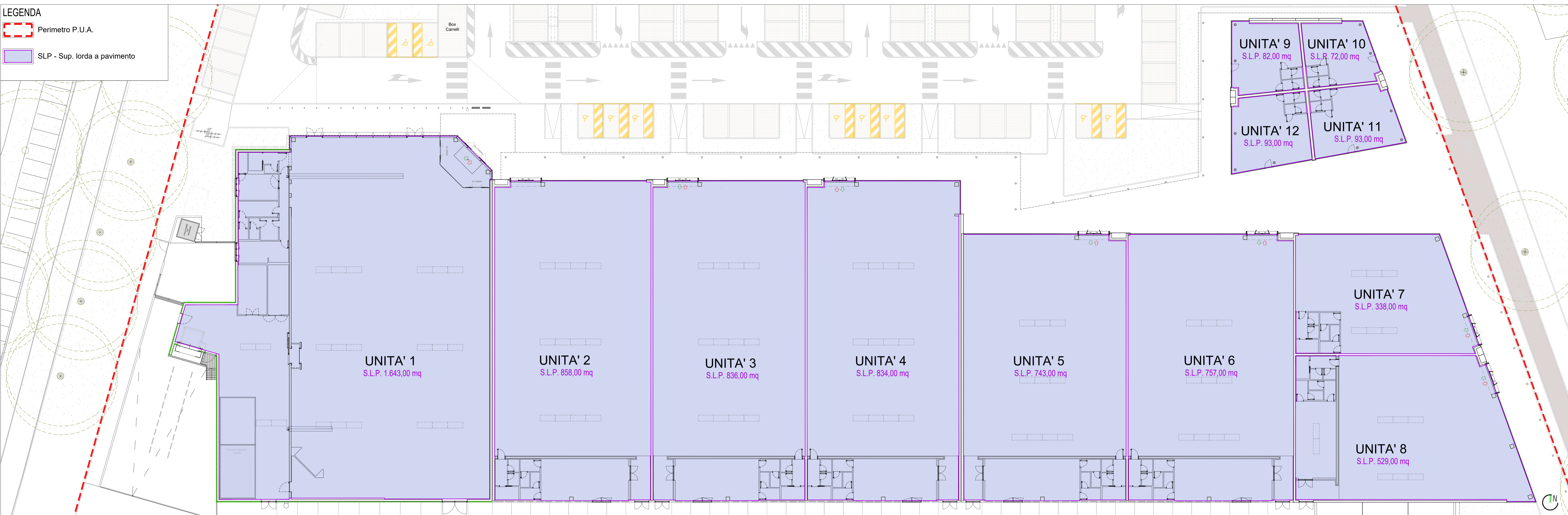
PLANIMETRIA GENERALE - Individuazione SLP - scala 1:200