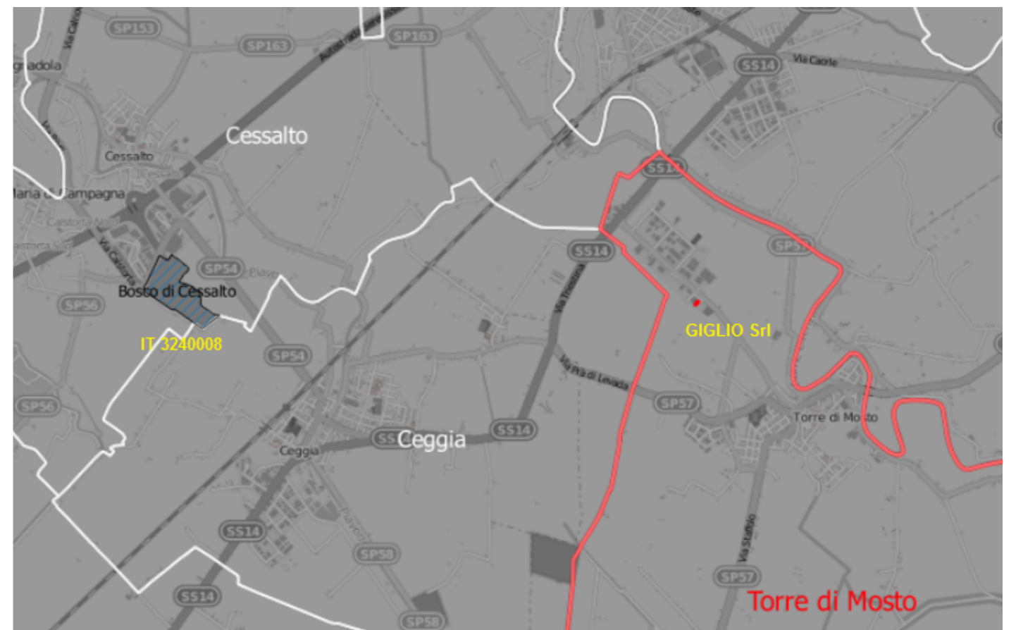
RETE NATURA 2000 - ZPS