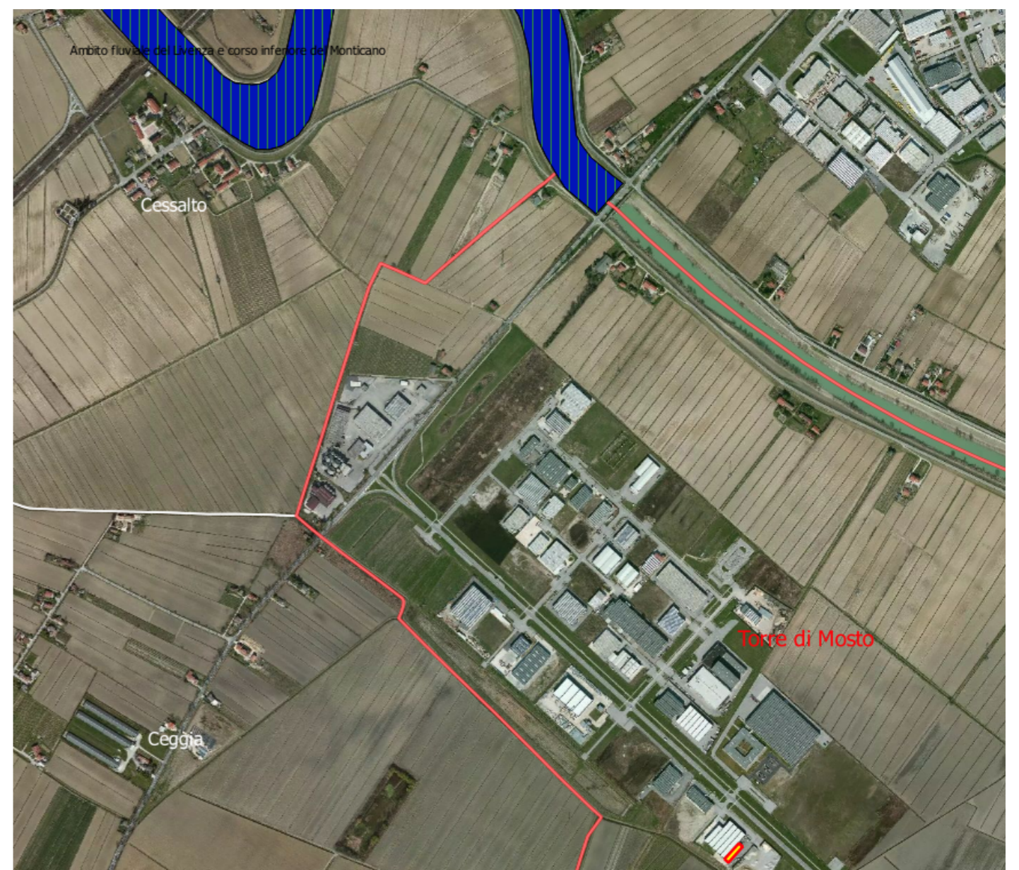
RETE NATURA 2000 - HABITAT