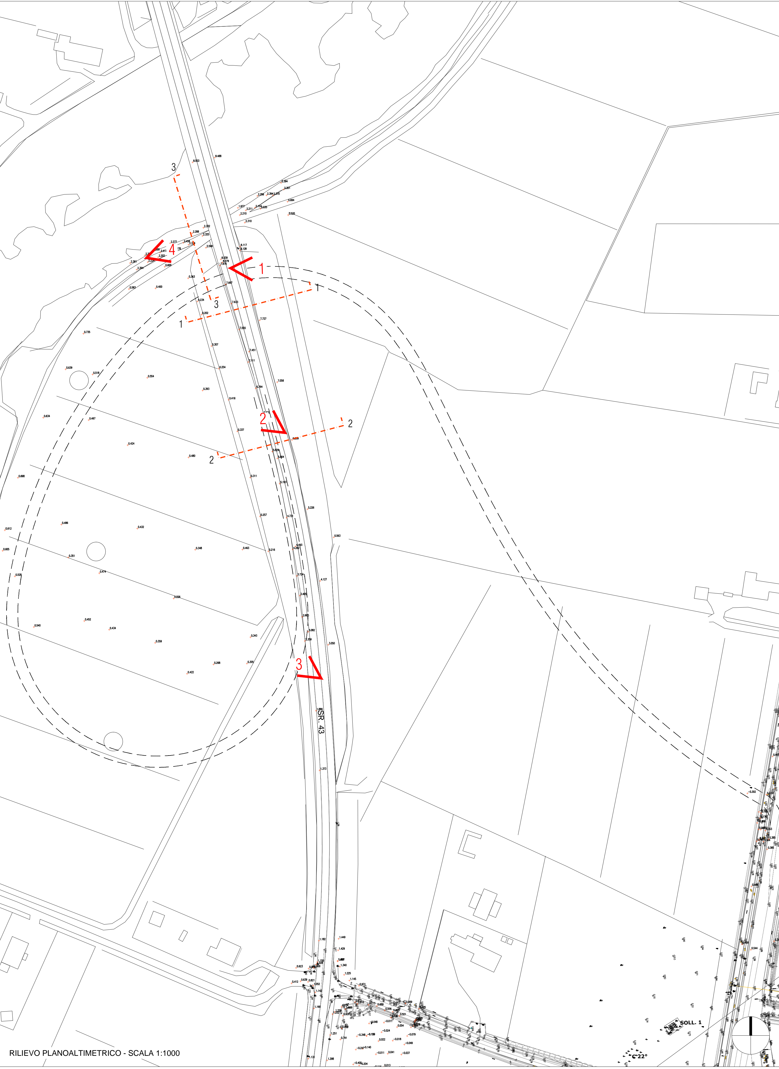
RILIEVO PLANOALTIMETRICO - SCALA 1:1000