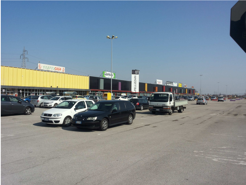
07_ vista della proprietà non oggetto della proposta progettuale