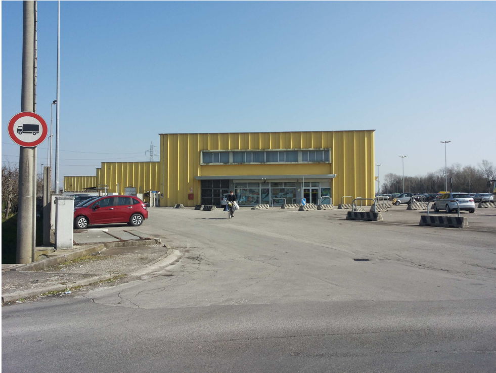
01_ vista del lato ovest da via Bastie