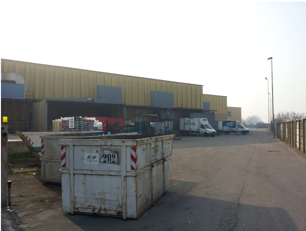
10_ vista dell'area carico/scarico da nord-est