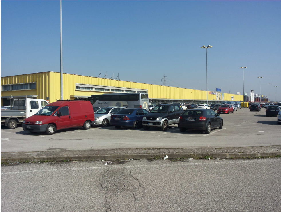
03_ vista del lato sud dell'intero edificio