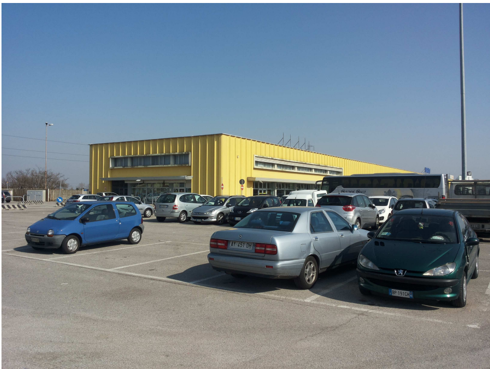
02_ vista angolo sud-ovest da SS 309 Romea