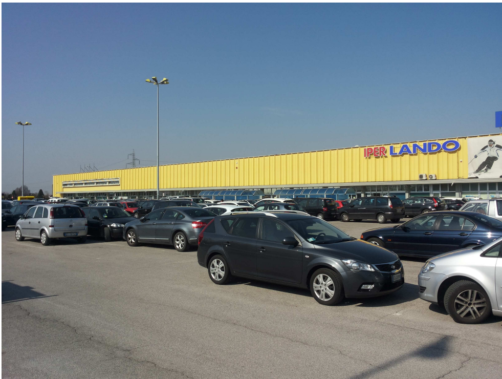
04_ vista da est della proprietà del proponente