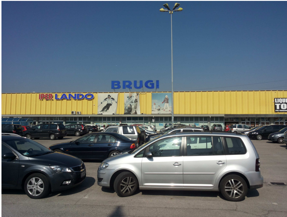
05_ particolare della futura zona d'ingresso