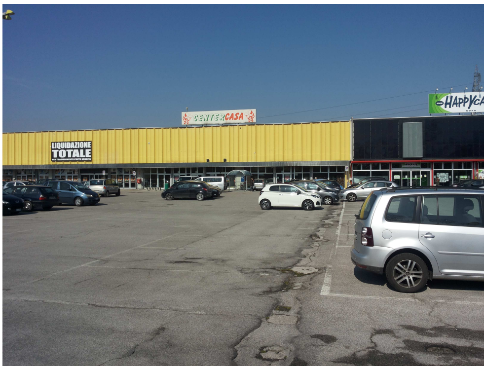
06_ vista del confine tra le due proprietà