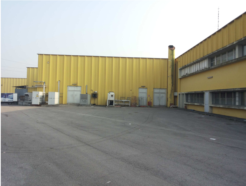
09_ particolare della prima area carico/scarico a nord