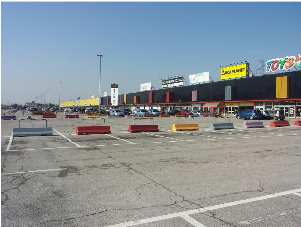
08_ vista di tutto l'edificio