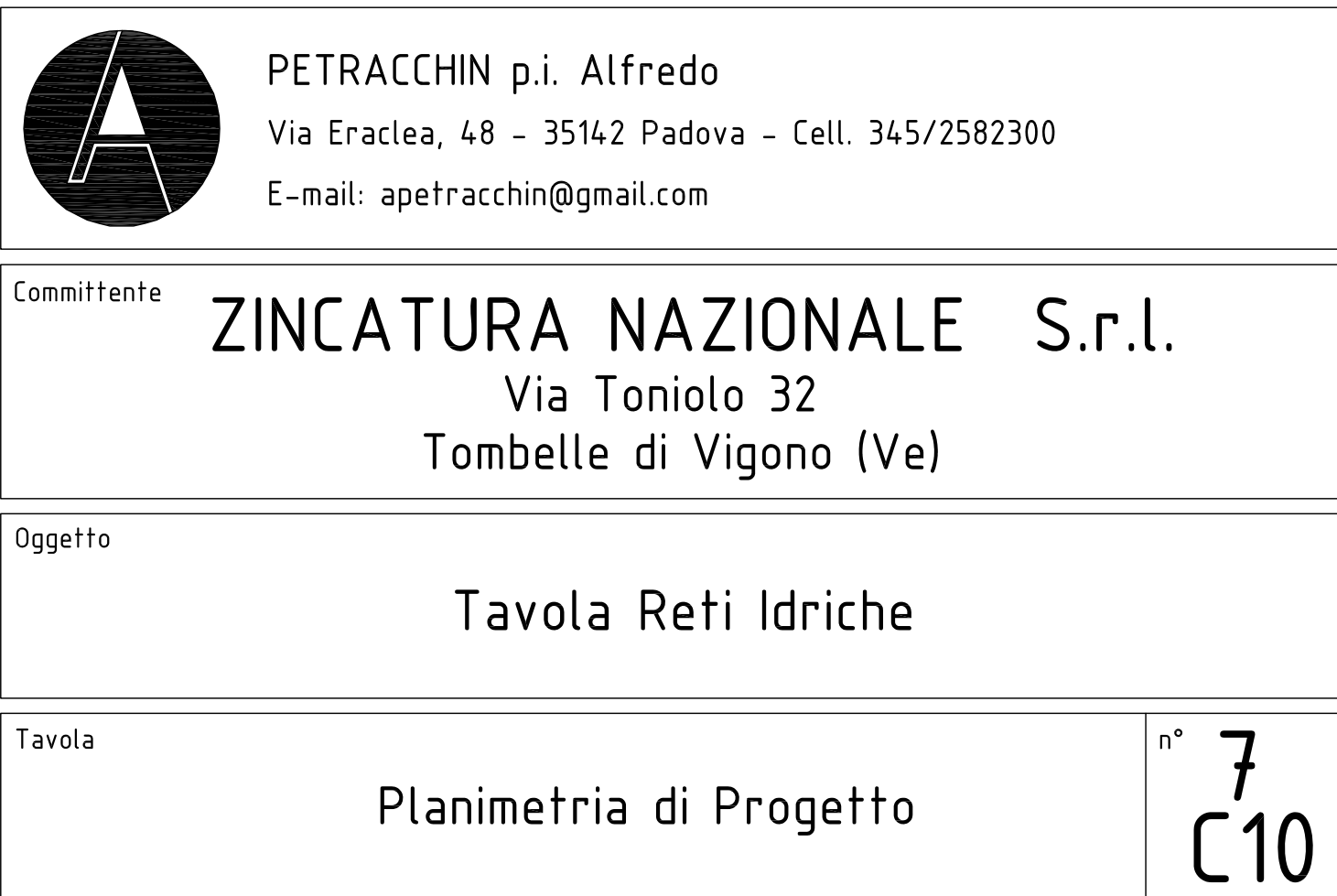
PLANIMETRIA SCHEMA FOGNARIO scala 1:500