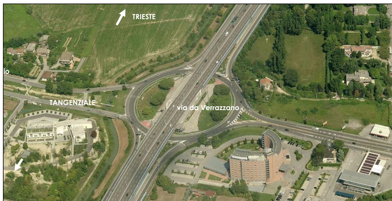
Figura 1 – Rotatoria in esame

La Direzione mobilità del Comune di Venezia ha esaminato il progetto degli interventi sulla mobilità del nuovo centro commerciale Lando in previsione della Conferenza dei Servizi regionale.