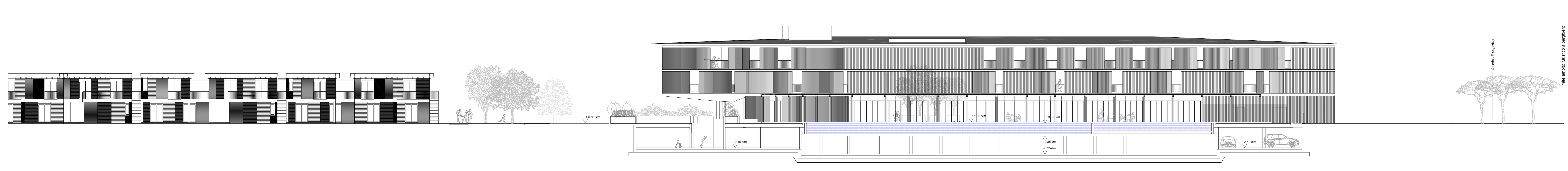
SEZIONE 4-4 nord - sud : parco / solarium / residenze turistico alberghiere (vista ovest)