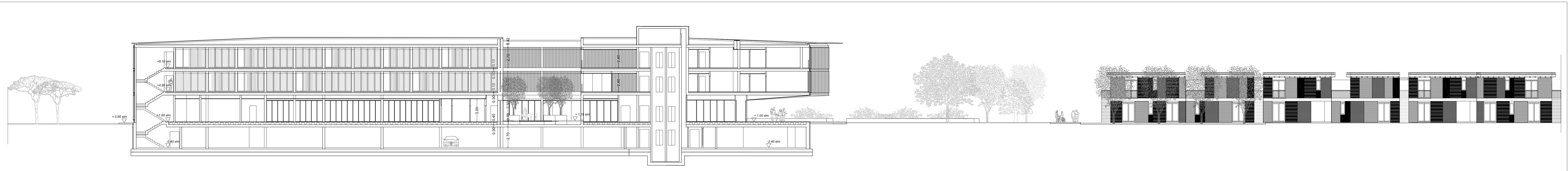
SEZIONE 3-3 nord - sud : parco / albergo (vista est) / residenze turistico alberghiere